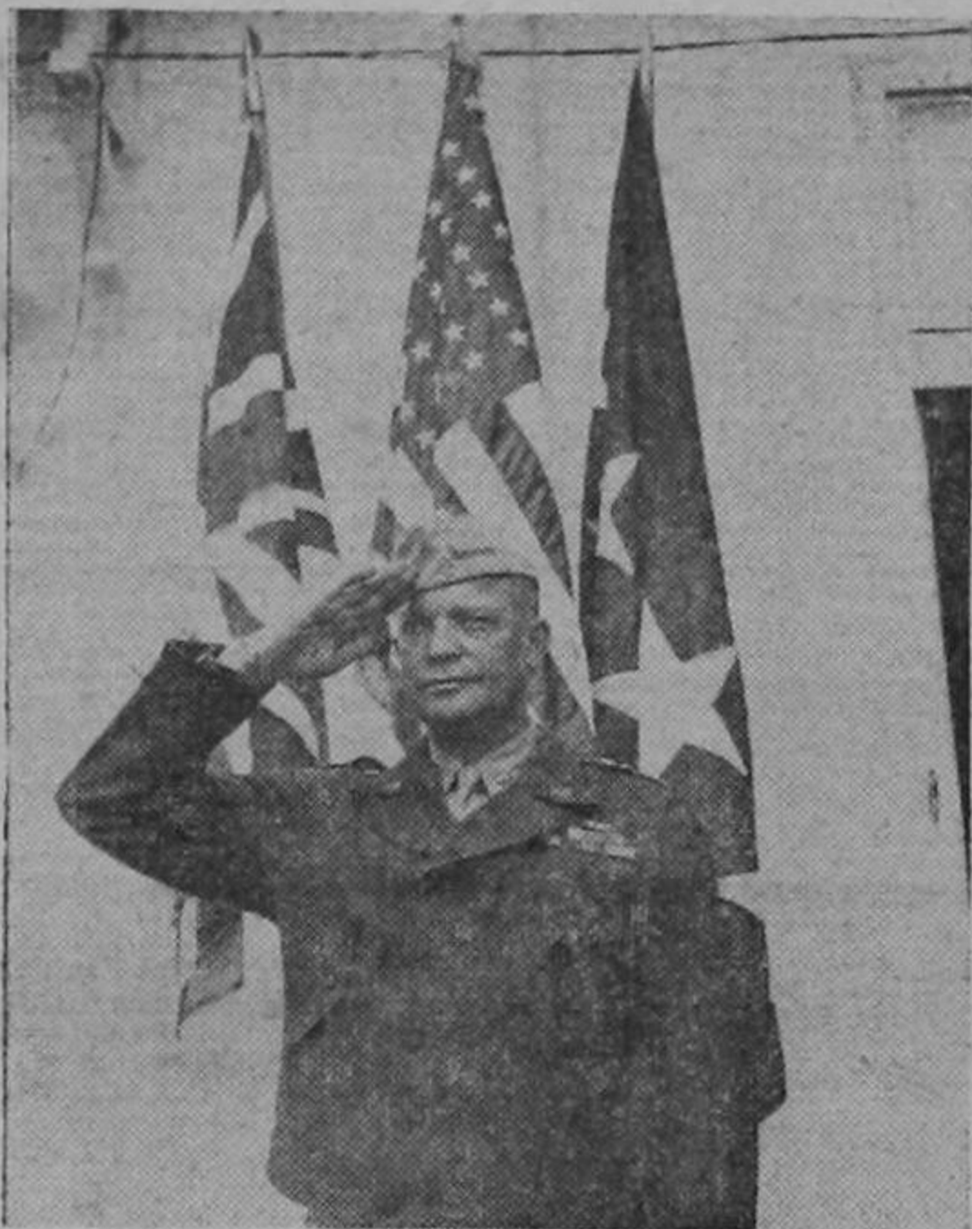
El general norteamericano Dwight D. Eisenhower, comandante de las fuerzas armadas de las Naciones Unidas que después de una brillante y poderosa ofensiva desbarataron la resistencia del Eje en África y ocuparon las bases fortificadas de Túnez y de Bizerta.