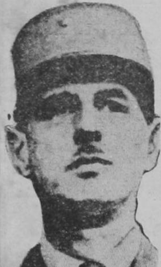
GRAL. DE GAULLE

quién está semana conferenciará con Giraud